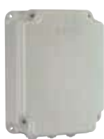
Корпус мод. E для плат управления