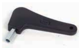
Дополнительный ключ для разблокировки привода