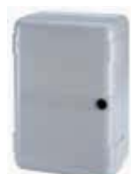
Корпус мод. LM для плат управления