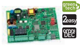
Плата управления E045 Технические характеристики на стр. 135