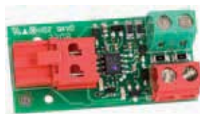
Интерфейс BUS XIB (в случае применения платы E024S с фотоэлементом, не поддерживающим шинное соединение)