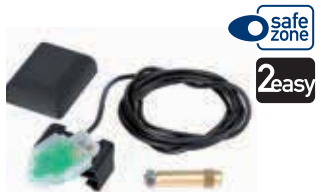
SAFEcoder для привода 412 (Патент FAAC)