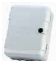
Корпус мод. L для плат управления