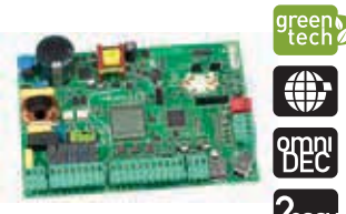
Плата управления E145 Технические характеристики на стр. 136