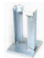
Кронштейн для встроенного в стену монтажа