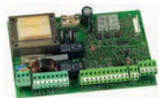
Плата управления 455 D ((пока есть на складе)) Технические характеристики на стр. 134